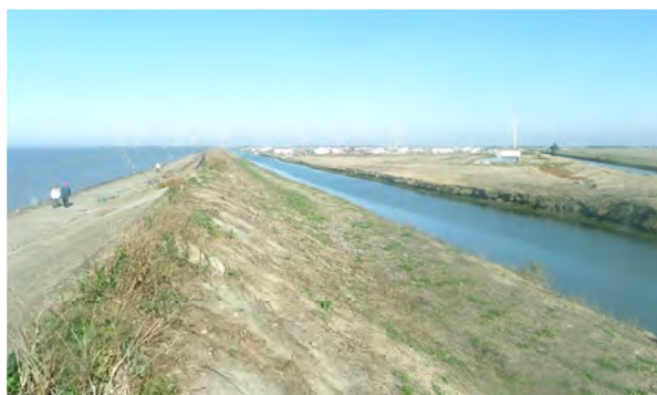
Digues de protection contre la submersion marine

Depuis la tempête Xynthia en février 2010, la prévention des risques littoraux s'est structurée à partir des programmes d'actions portés par les collectivités et subventionnés par l'État, la Région et les Départements. 9 programmes d'actions pour la prévention des inondations (PAPI) instruits par la DREAL couvrent une majorité de la façade des Pays de Loire. La DREAL accompagne les autorités gestionnaires des digues pour définir un niveau de protection contre la submersion marine et réaliser des travaux de confortement.