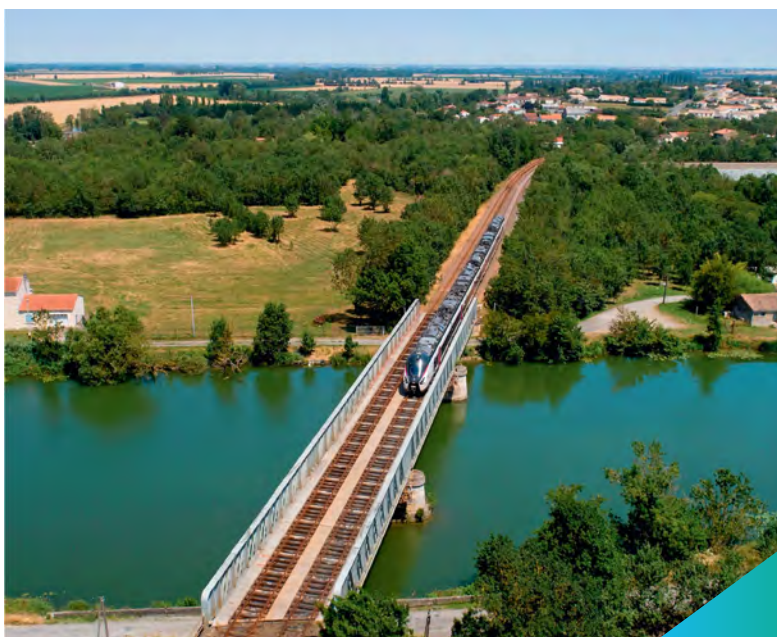
© DREAL Pays de la Loire / Modernisation de la ligne Nantes- Bordeaux