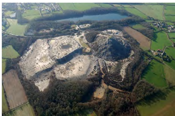
© DREAL Pays de la Loire / Ancienne mine d'Abbaretz

Depuis 10 ans, des usages de loisirs se sont peu à peu développés sur l'ancienne mine d'Abbaretz d'extraction d'étain. Ils exposent les usagers à des risques du fait d'une concentration importante en arsenic dans le sol. L'interdiction d'accès au site, à l'exception du chemin pédestre périphérique, a été présentée en réunion publique en juillet. Des clôtures et des panneaux ont été posés pour délimiter les zones interdites. Un plan de gestion renforcera les aménagements de sécurisation du lieu et le traitement des eaux pluviales.