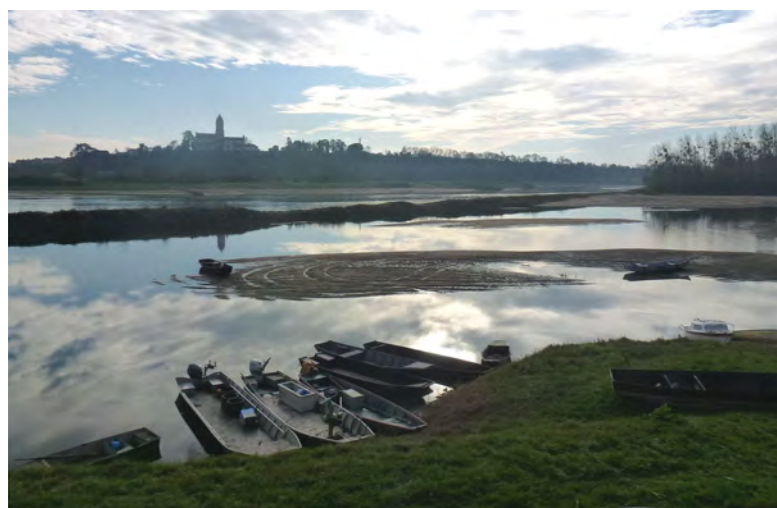
Varades, vue sur Saint-Florent-le-Vieil

L'enquête publique pour le projet de classement s'est déroulée du 13 mai au 13 juin 2019. Le dossier sera examiné en commission supérieure des sites, perspectives et paysages en 2020 avant d'être transmis au Conseil d'État.