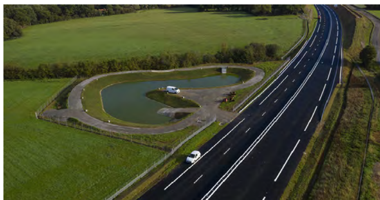
déviation de Bouvron

Lors de l'inauguration, la DREAL a organisé des visites commentées en bus pour la population. Deux classes d'élèves de primaire de Bouvron ont pu découvrir, la veille, les mesures environnementales mises en œuvre dans le cadre du projet.