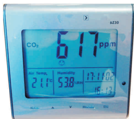
DREAL Pays de la Loire : enregistreur de données sur la qualité de l'air intérieur (Co 2 )

La surveillance de la qualité de l'air intérieur des établissements publics d'accueil collectifs d'enfants de moins de 6 ans et des écoles primaires est obligatoire au 1 er janvier 2018. Pour informer et accompagner les collectivités locales et les exploitants de ces établissements, la DREAL, et les DDT(M) ont organisé en octobre 2017, 3 réunions d'information en partenariat avec l'agence régionale de santé (ARS) à Laval, au Mans et à Nantes. En outre, la DREAL et les DDT(M) mettent à disposition des matériels de mesure de la qualité de l'air dans les écoles. C'est une action du plan régional santé environnement (PRSE3).