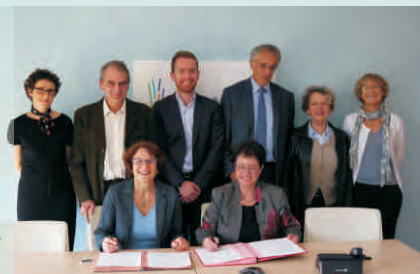
Signature de la convention MRAE

En octobre 2016, une convention définissant les modes de fonctionnement a été signée entre la MRAE des Pays de la Loire et la DREAL. La division concernée de la DREAL est désormais sous l'autorité fonctionnelle de cette mission pour les décisions et avis sur différents plans et programmes, lorsqu'ils sont soumis à évaluation environnementale ou à examen préalable au cas par cas. Cela concerne, par exemple, le schéma d'aménagement et gestion des eaux (SAGE), les plans climat air énergie territoriaux et les documents d'urbanisme des collectivités (plans locaux d'urbanisme, schémas de cohérence territoriale, cartes communales).