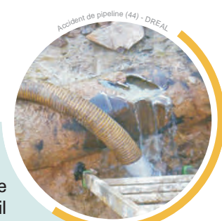
Accident de pipeline (44) - DREAL

Gestion des suites de l'accident de pipeline de Sainte-Anne sur Brivet (44)