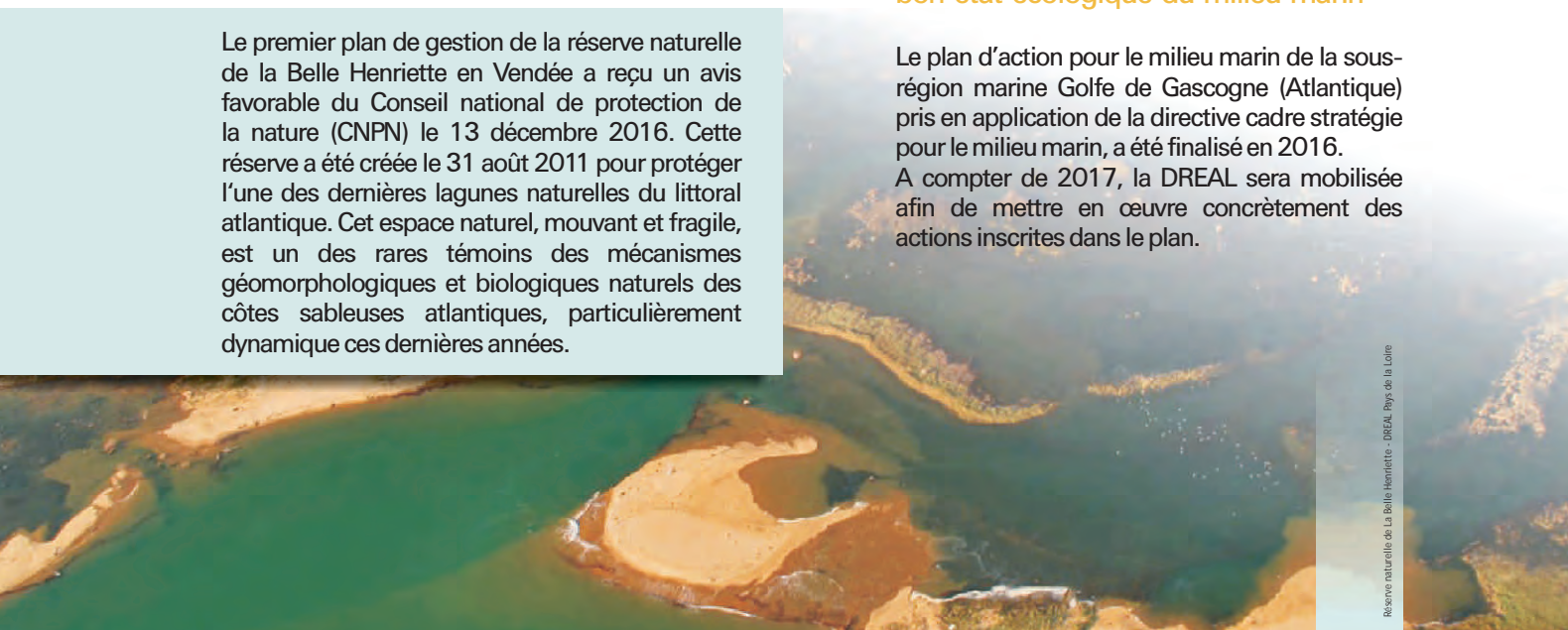
Reserve naturelle de la Belle Henriette - DREAL Pays de la Loire

Le plan d'action pour le milieu marin de la sous-région marine Golfe de Gascogne (Atlantique) pris en application de la directive cadre stratégie pour le milieu marin, a été finalisé en 2016. A compter de 2017, la DREAL sera mobilisée afin de mettre en œuvre concrètement des actions inscrites dans le plan.